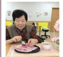
お花見ドライブの日に桜味の甘味を楽しみました