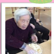
豆腐もちでお汁粉を作りました