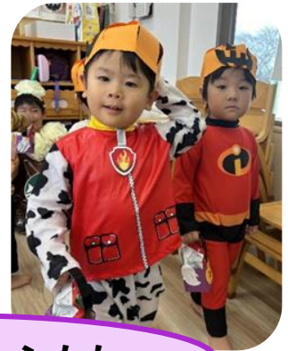
ハッピーハロウィン！！