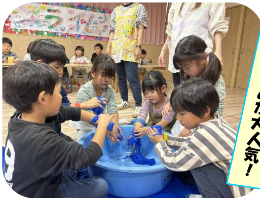
スライムが大人気!