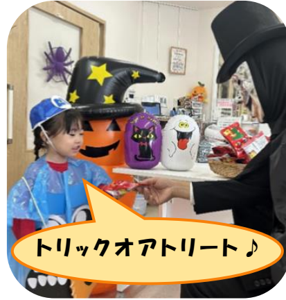
トリックオアトリート♪