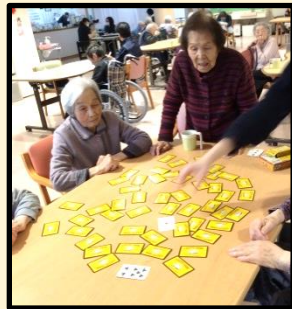
みんなで神経衰弱! 何枚とれるかな?