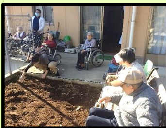
日向ぼっこをしながら、庭に花を植えました。