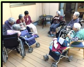
中庭での談笑タイム。外の空気が気持ち良くて、おしゃべりも弾みます。