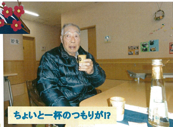
ちよいと一杯のつもりが!