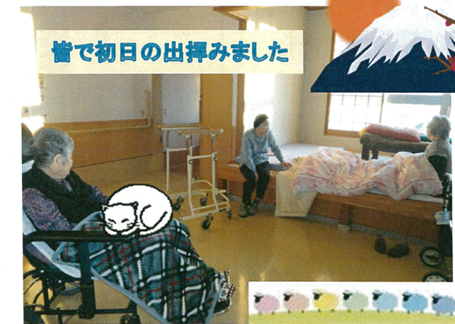
皆で初日の出拝みました