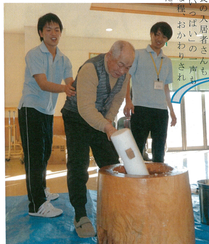
おいしく頂きました

昨年はお餅をつくの職員ばかりでしたが、今年は見学さんねえ。こうするんだ!とばかりに入居者さんが参戦。心配し駆け寄る職員などなんのその。さすが年の功。まるで孫に教えるかのように指導していました。 つきたてのお餅は熱々のうちに、あんこ・黄な粉・辛味の三種の味で頂きました。 普段は少食の入居者さんでも「もうお腹いっぱい!」の一声も苦しそうな程、おかわりされていました。