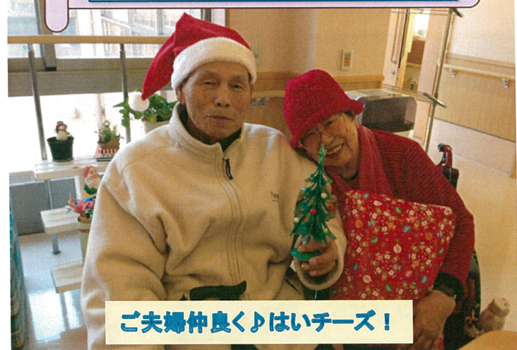
ご夫婦仲良く♪はいチーズ!