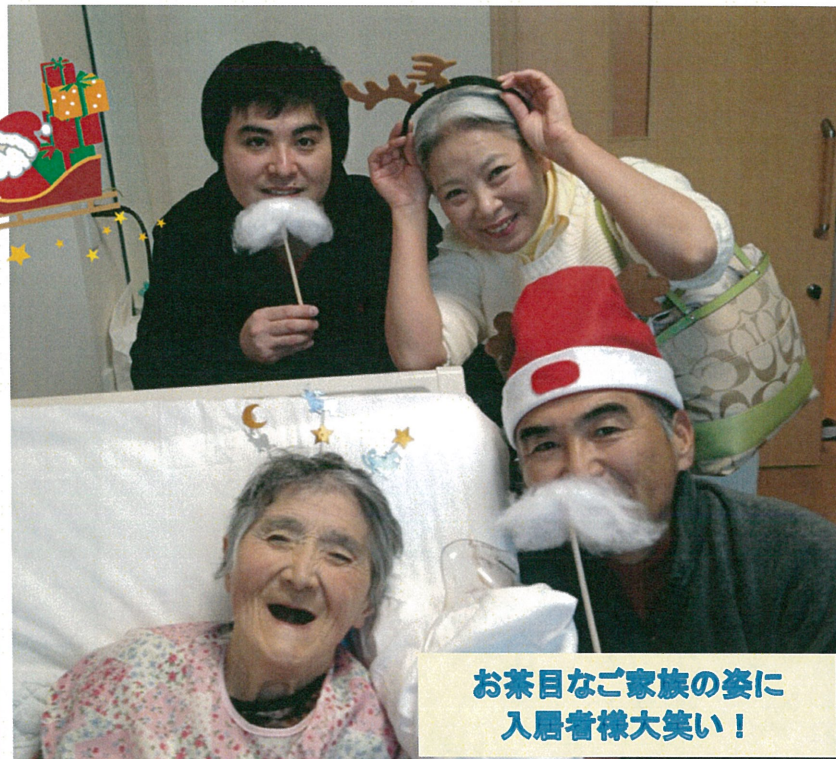
お茶目なご家族の姿に 入居者様大笑い!

★家族会終了後に行われたクリスマス会には、沢山のご家族が参加され、賑やかな時間となりました。 ユニット毎に考えたテーマでクリスマス会を実施。初めての試みでドタバタと落ち着かない部分もあったものの、「ご家族の方から「楽しませていただきました」と感謝の声を頂きました」