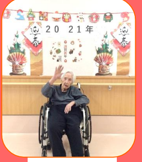
書初め♪ ゆったりとしたお正月でした