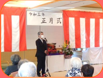
1/3正月式開催！ 全員での顔合わせ