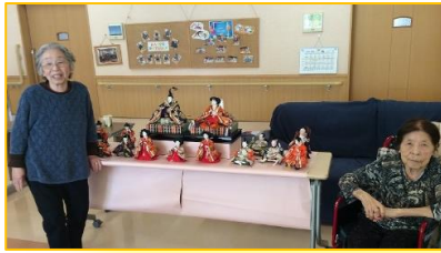
季節の行事も しっかりと！