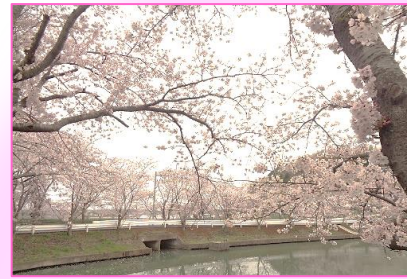
今年の桜は車窓から