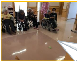
体も動かして 気分転換♪