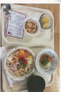
本日は正月メニュー！

今年から始まった 「飛羽男・飛羽女」 抽選！ 初代はこちらの4名です！ 今年は各行事にひっぱりだこの 予感。忙しい年になりますね～