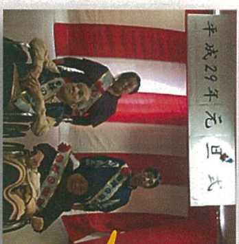
「飛羽男・飛羽女」決定！