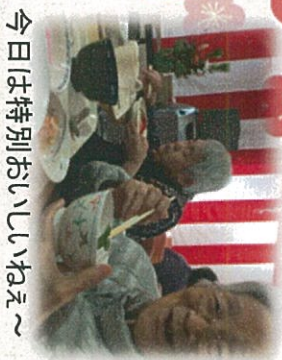
今日は特別おいしいねえ～