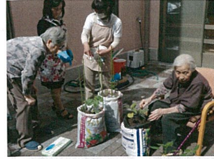
きゅうり。ピーマン。なす。 美味しく収穫できるかしら?