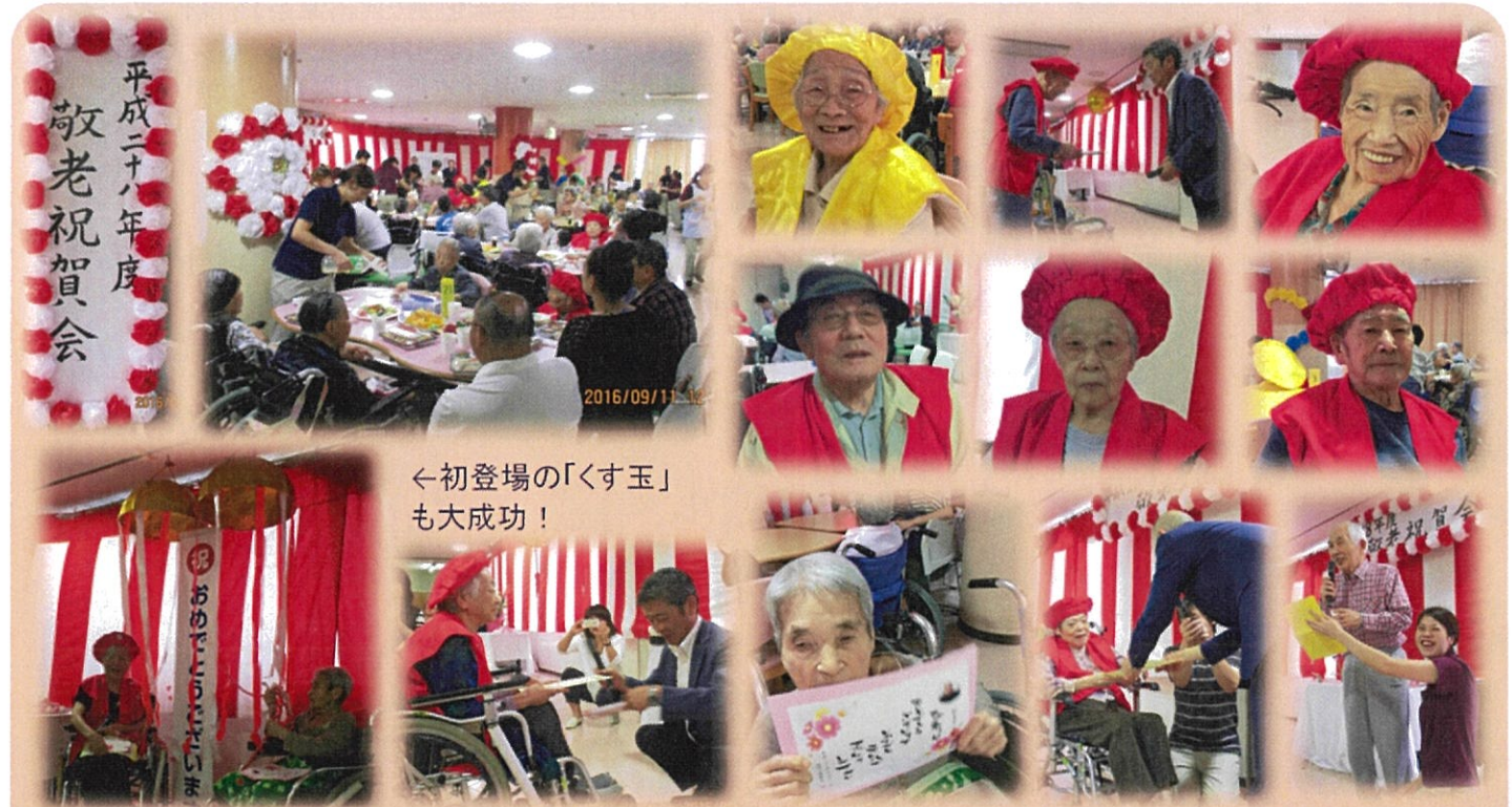
←初登場の「くす玉」も大成功!

9月11日に「敬老祝賀会」を開催致しました。今年には米寿(88歳)を迎えられた方が6名、喜寿(77歳)を迎えられた方が3名おり、賞状を贈呈させて頂きました。また、今年の飛羽ノ園最高齢は98歳!! 足腰丈夫で笑顔の素敵な女性のご入居者様です。今年もたくさんの来賓の方から温かい祝辞を賜り、ボランティアの方からは素敵な踊りを披露して頂き、職員一同心より感謝申し上げます。来年も皆様のお力をお借りして「たくさんの笑顔」に溢れた敬老祝賀会を開催できるよう頑張りますので、宜しくお願い致します。