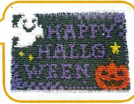
↑「綿棒アート」。たくさんの綿棒を台紙挿し、絵を完成させました(^)v