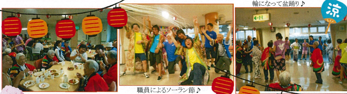
職員によるソーラン節♪