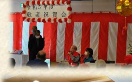
桜川保育園からのお祝い ビデオメッセージ