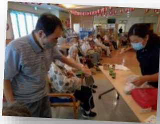
千本引き どれが当 たかな？