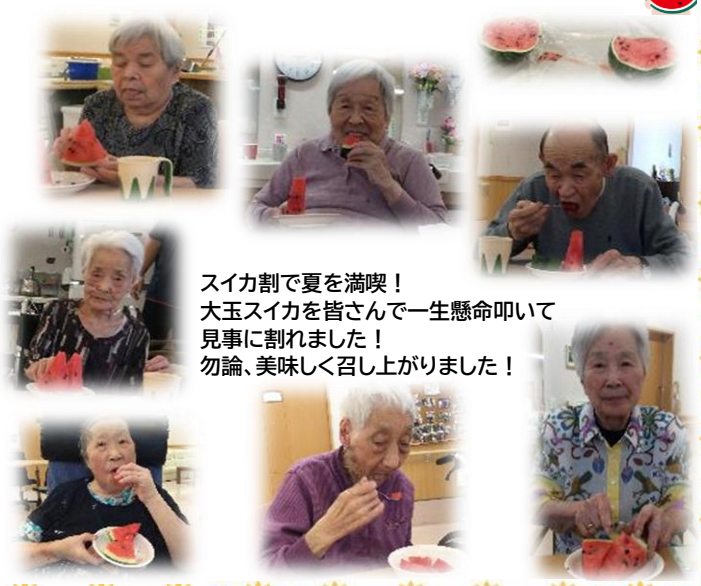
スイカ割で夏を満喫！ 大玉スイカを皆さんで一生懸命叩いて 見事に割れました！ 勿論、美味しく召し上がりました！