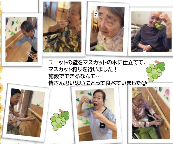
ユニットの壁をマスカットの木に仕立てて、 マスカット狩りを行いました！ 施設でできるなんて… 皆さん思い思いにとって食べていました◎