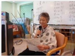
月がく 出た く 出た ♪