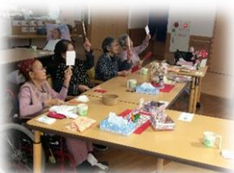
紅白旗揚げゲームで頭と体を使って楽しみました。