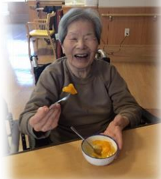
いつも美味しいおやつ、ありがとう