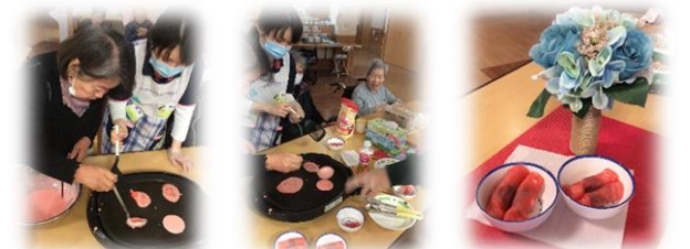
自分たちで作ると手間をかけた分、更に美味しくなりますよね。